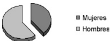
Gráfico 2. Ganancia media por trabajador/a y mes, según sexo

Otro dato muy significativo de la situación de desigualdad de las mujeres respecto de los hombres en el ámbito laboral es el relativo a la diferencia de salario: en iguales puestos de trabajo las mujeres cobran menos que los hombres.